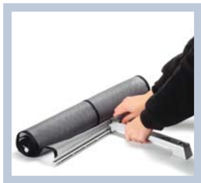
A rendszer szétszereléséhez csak válassza le a támasztórudat és a lábat, majd hajtsa össze az anyagot.